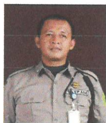
DIAN PPNPN BAG. SATPAM (Staf Hukum)